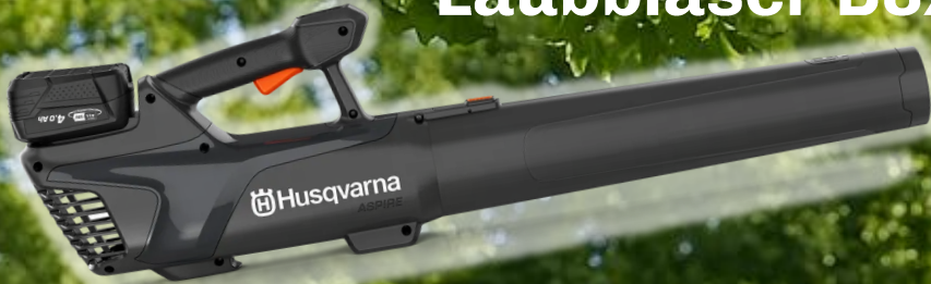
Husqvarna Aspire Laubbläser B8X