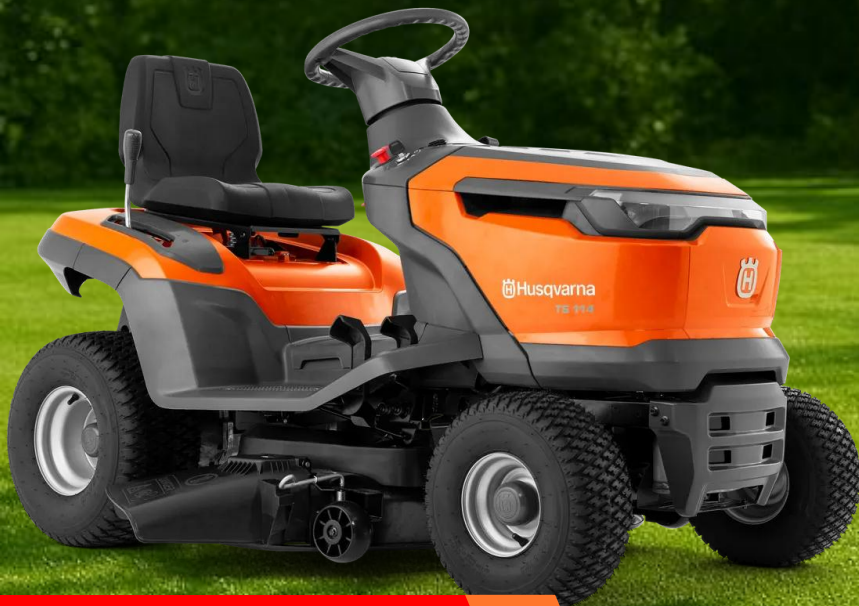
Husqvarna TS 114