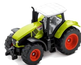
AXION 950 Mini-Edition