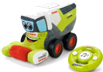
Plüsch RC LEXION 8900