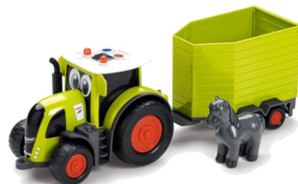
AXION 870 + Pferdeanhänger + Pferd