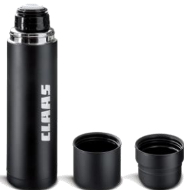
Thermoskanne mit 2 Bechern