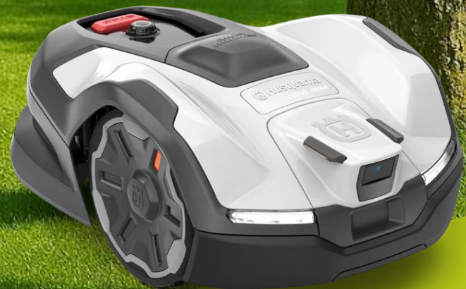
Husqvarna 410 VE NERA